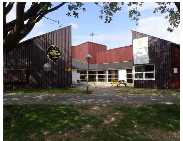
Aarhus Fremads eksisterende klubhus. Træbeklædte facader i rød-brune nuancer med glasgange og klubben manifest på gavlen.

På toppen ad administrationsbygningen placeres TV-tårnet og kommentatorboksen, med gode udsigtsforhold og med kameratelet rettet mod den stemningsskabende tribune på den modstående side.